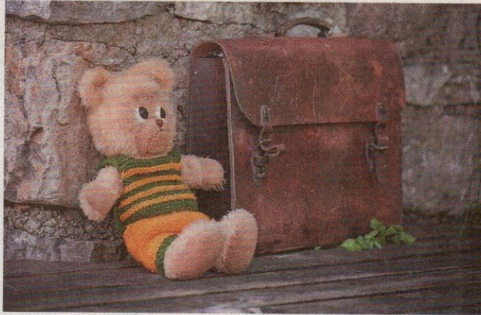
▲ Un vieux cartable délaissé

« Je n'ai pas à choisir entre la santé de mon enfant et sa scolarité, mes enfants sont tout pour moi. »