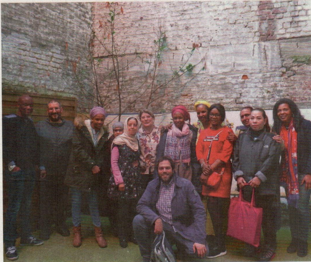
▲ Les apprenants du QUEF et de Lire et Ecrire avant le confinement