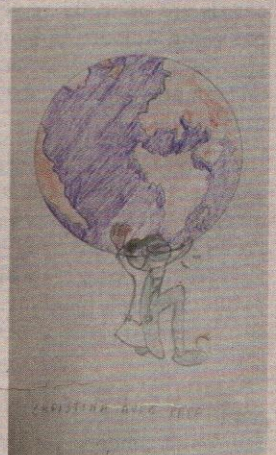
▲ Un monde qui s'effondre ? © Ensemble Pour 10601