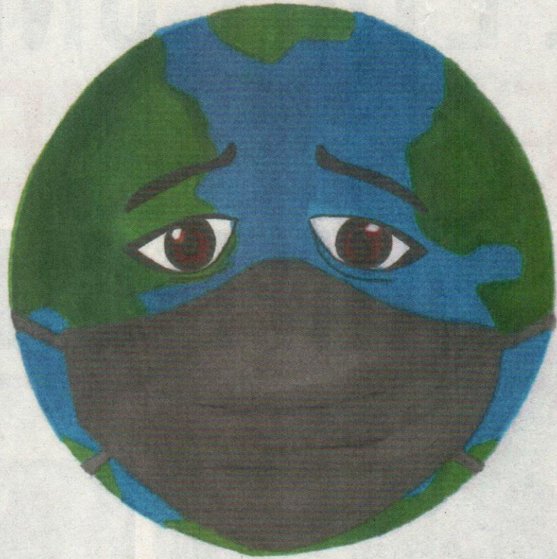
▲ Notre terre selon Mayssa © Ensemble Pour 1060!